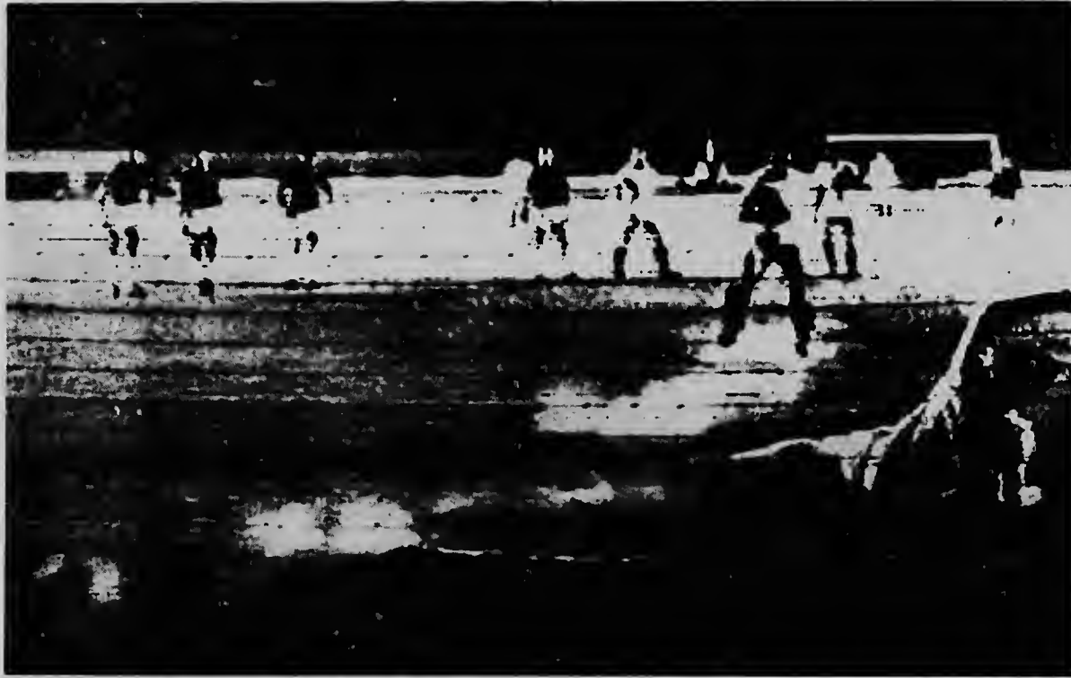
LIMA, Peru--Radiophoto UPI- Raul di Cruzeiro ta ser derrota pa Chumptiza di Universitario cu un penalty. E schijnbeweging ta visto aki riba.